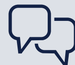
Consultoria e intervenção em conferências