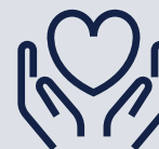
granty i darowizny na cele charytatywne